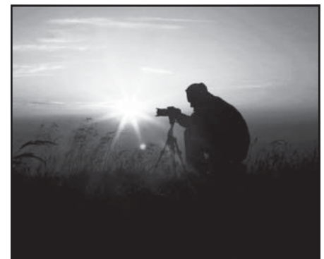
To som ja na Kráľovej holi