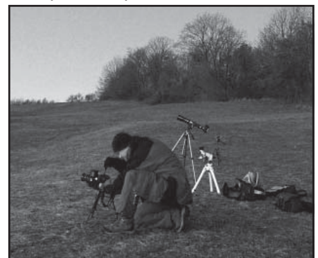
Opäť ja počas pozorovania na kopci Laskomer pri BB