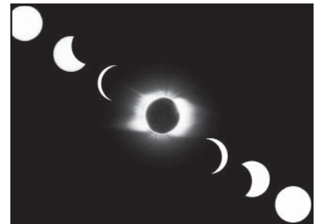
Úplne zatmenie Slnka, pozorované na Sibíri 2008